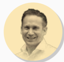
Directeur eCommerce SPAR

Le Nocturnal Living montre à quel point les habitudes des gens sont en pleine mutation. Elle souligne aussi qu'une tendance se développe rarement seule. Grâce au succès du concept de Midnyt, d'autres commerces d'alimentation ont compris qu'il existait un besoin de livraison à la demande. Cela a conduit à des partenariats avec des entreprises de renommée internationale, comme SPAR, qui proposent leur assortiment pendant la journée et s'adressent ainsi à des personnes souhaitant organiser leur quotidien le plus efficacement possible. Sur d'autres marchés de Just Eat, comme l'Allemagne et le Royaume-Uni, la livraison à la demande fait déjà partie intégrante du comportement de commande de nos clients. Nous allons maintenant voir comment ces tendances entraînent également une augmentation des commandes pendant les heures creuses en Suisse.